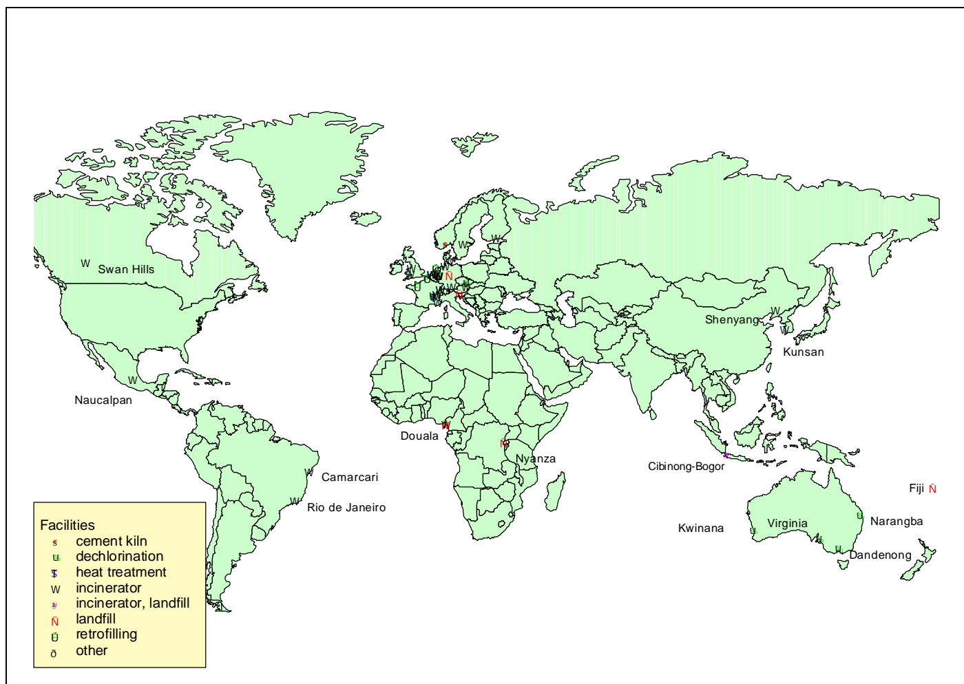
Figure 1 Worldwide PCB Destruction Facilities Described in Questionnaires