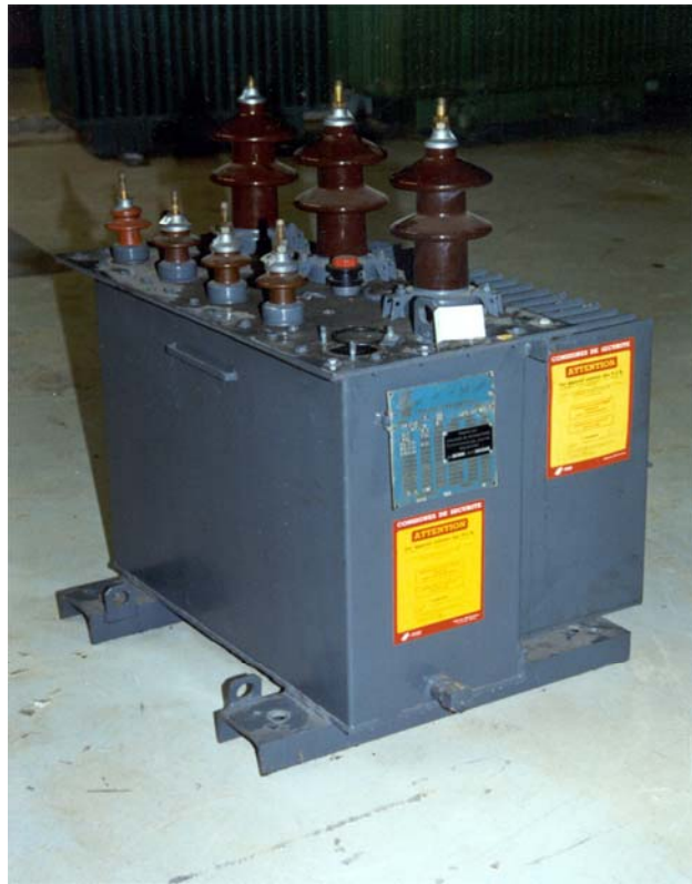
محولة كهربائية نموذجية : لاحظ لوحات التعريف بالمُصنِع و لصاقات التحذير