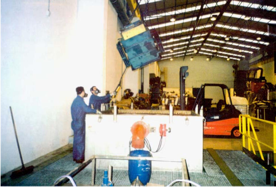
عمال يرتدون ألبسة الحماية أثناء تعاملهم مع المُحولات الكهربية الحاوية على مُركبات PCB